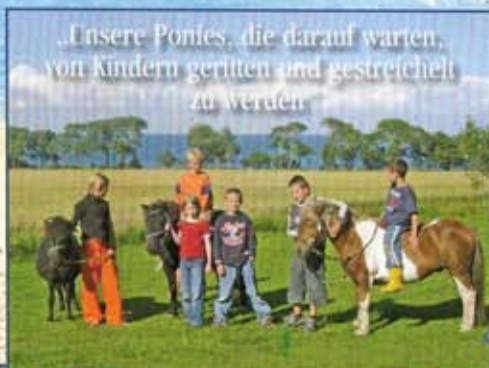
„Unsere Ponies, die darauf warten, von Kindern geritten und gestreichelt zu werden.“